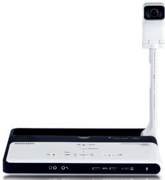
P3500M: El dispositivo para videoconferencia portátil de Ricoh.